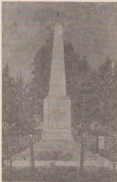
Обелиск в селе Клочково