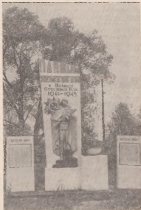
Обелиск в селе Пустошь