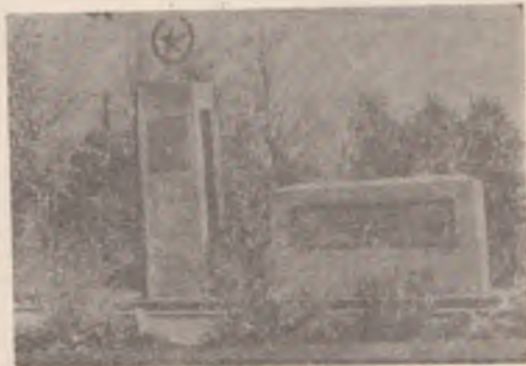
Обелиск в поселке Колобово