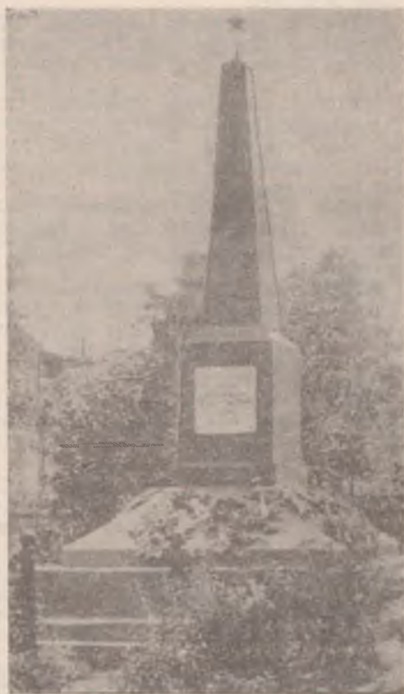
Обелиск в селе Васильевском