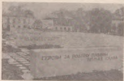
Мемориал Славы в память шуян, погибших на фронтах Великой Отечественной войны 1941—1945 гг., Центральная площадь г. Шуя