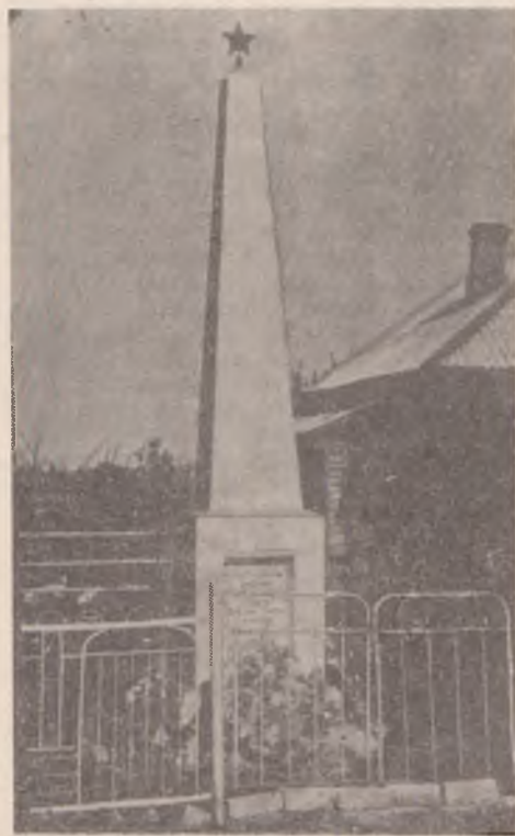
Обелиск в деревне Харитоново