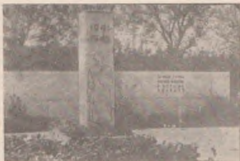
Обелиск у ткацко-отделочного объединения, г. Шуя