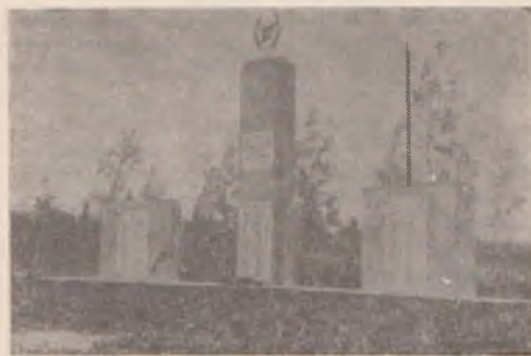
Обелиск в деревне Перемилово