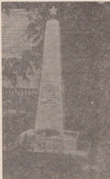
Обелиск у фабрики «Шуйский пролетарий»