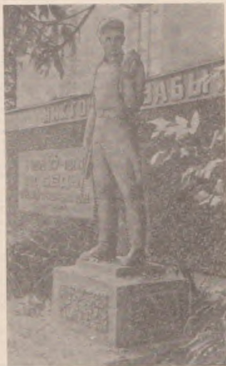
Обелиск в память о погибших рабочих Шуйско-Тезинской фабрики