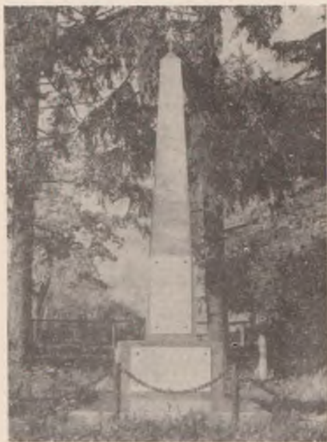
Обелиск в селе Красноармейское