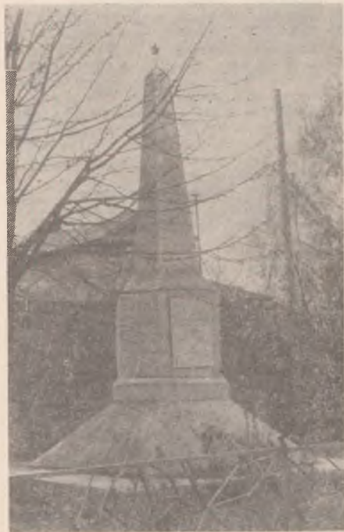
Обелиск в селе Дорожаево