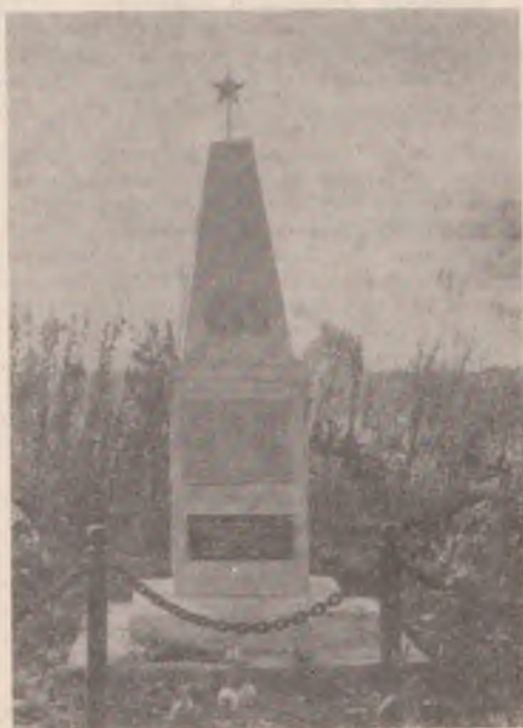
Обелиск в деревне Палкино