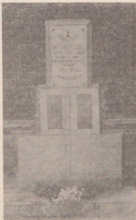
Мемориальная плита у средней школы № 1 в память о воспитанниках, погибших на фронтах Великой Отечественной, г. Шуя