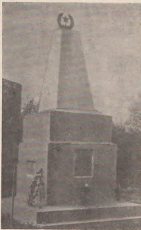
Обелиск в селе Змеево