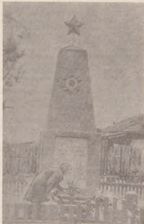
Обелиск в деревне Мягово