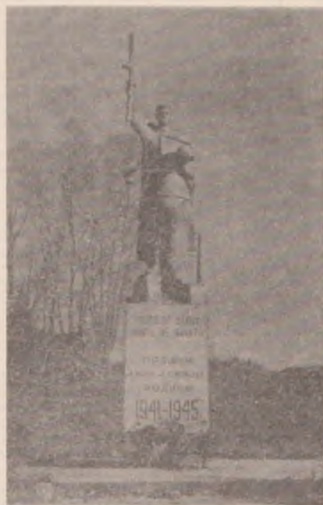
Обелиск в деревне Арефино Милюковско-го сельсовета, Шуйский район