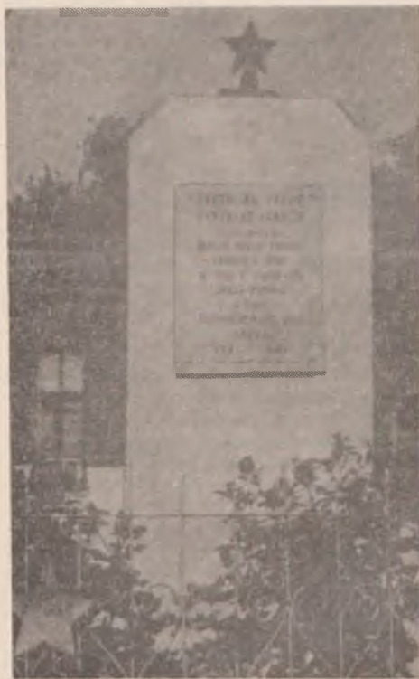
Обелиск в деревне Милоюковка