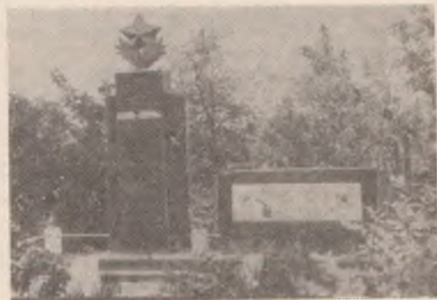
Обелиск в селе Дунилово