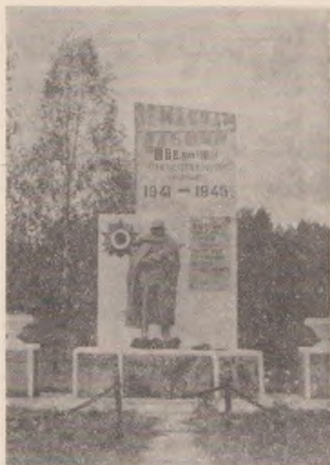
Обелиск в деревне Михалево