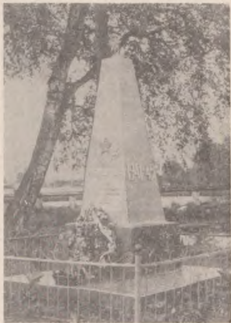
Обелиск в деревне Остапово