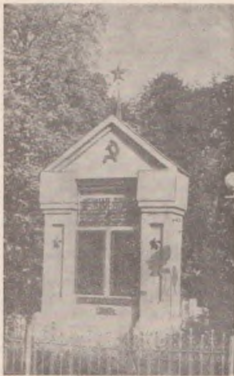
Обелиск в селе Чернцы