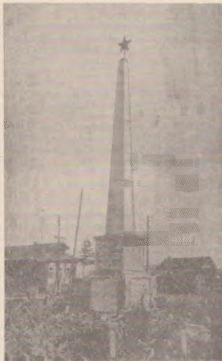
Обелиск в селе Введенье